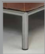
Metallrahmen F D3 matt – Metal frame F D3 matt

Diese Fußformen sind zum Modell [capriccio] erhältlich.