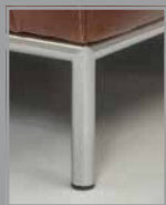
Metallrahmen F D2 chromglänzend – Metal frame F D2 high- gloss chrome