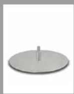
Drehplatte F PM matt – Turntable F PM matt