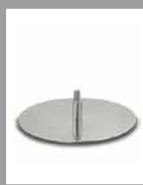
Drehplatte F PG chromglänzend – Turntable F PG high- gloss chrome

These legs are available for [capriccio] .